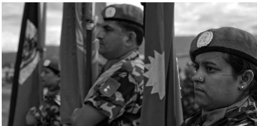
▲ Efectivos militares de mantenimiento de la paz nepaleses en una parada militar. Puerto Príncipe, Haití. Marzo de 2009.

La asesoría operacional a los Estados Miembros también debiera enfatizar la importancia de designar un punto focal dedicado al género dentro de cada contingente militar, con claros términos de referencia. El punto focal de género de los militares proporcionaría asesoría continua para los comandantes del contingente sobre cómo una perspectiva de género puede mejorar la eficacia y eficiencia de las tareas operacionales del contingente, y ofrecería capacitación a los miembros del contingente dirigida al género en la misión. Los puntos focales de género servirían como puntos principales de enlace entre el contingente y la Oficina del Asesor de Género de la misión de mantenimiento de la paz.