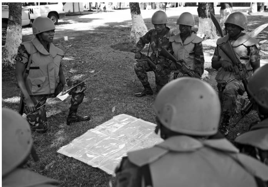
▲ Efectivos militares de mantenimiento de la paz ghaneses en Buchanan, Liberia. Abril de 2009.

evaluación técnica. Este enfoque asegurará que los asuntos de género influyan en los planes militares estratégicos y continúen informando sobre la planificación e implementación futura durante toda la misión de mantenimiento de la paz, a nivel operacional y táctico.