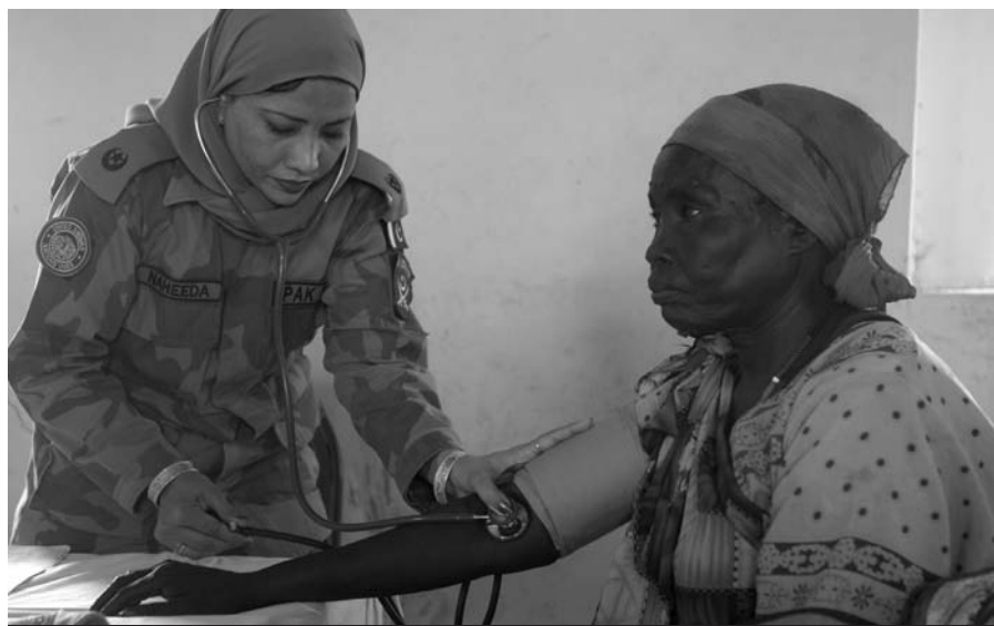
▲ Miembro de un equipo médico pakistaní trata a una paciente local en Ed-Damazín, Sudán. Noviembre de 2008.

La presencia de personal militar femenino también puede fomentar las estrategias de protección y respuesta, ya que las mujeres y niños locales pueden