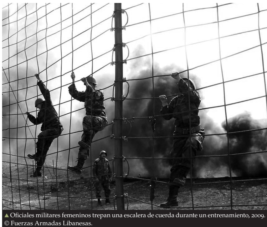
▲ Oficiales militares femeninas trepan una escalera de cuerda durante un entrenamiento, 2009.

El rol orientador desempeñado por los efectivos militares de la misión de paz hacia sus contrapartes de las fuerzas armadas del país anfitrión proporciona una oportunidad de liderar con el ejemplo, tanto en términos del perfil de los efectivos de la misión de paz, como sus estándares de comportamiento. El despliegue de efectivos militares femeninos de la misión de paz puede tener un impacto en cuanto a modelos a seguir, facilitando un mayor reclutamiento de mujeres locales a las fuerzas nacionales de seguridad. De igual valor es el rol de establecimiento de estándares de los efectivos militares de la misión de paz en términos de conducta y disciplina. Los efectivos militares de la misión de paz también debieran mantener los más altos estándares de profesionalismo militar y adherirse estrictamente a la política de tolerancia cero en relación con los actos de abuso y explotación sexual de las mujeres y niñas, a las cuales deben proteger en los lugares donde son desplegados.