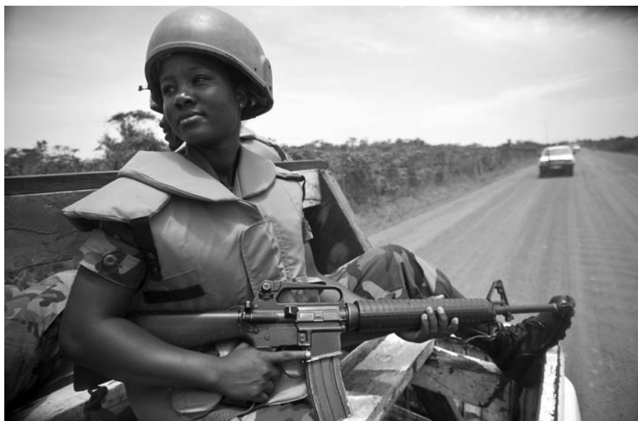
▲ Efectivo militar de mantenimiento de la paz ghanés en patrulla en Buchanan, Liberia. Abril de 2009.

durante esta tarea para asegurar una visión general más exhaustiva de la situación local. Por ejemplo, al realizar actividades al aire libre, tales como recolectar agua y leña, y en las actividades comerciales, las mujeres pueden observar de manera directa los movimientos y acciones que pueden afectar el ambiente de seguridad. Esta información puede elevar el entendimiento de los efectivos de la misión de paz sobre el ambiente de seguridad y mejorar sus intervenciones.